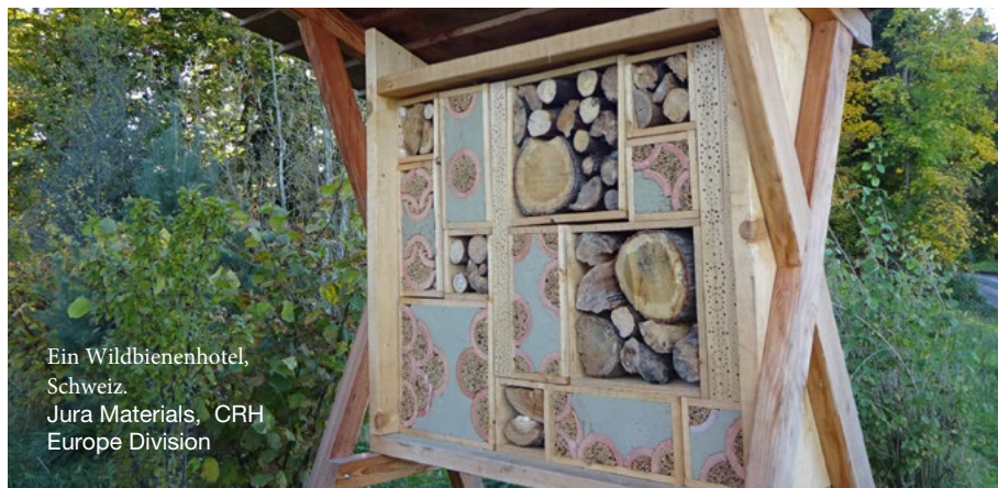
Ein Wildbienenhotel, Schweiz. Jura Materials, CRH Europe Division

Wir setzen vielfältige Kontrollmechanismen ein, um sicherzustellen, dass unsere Lieferanten die in diesem SCoC festgelegten Standards einhalten. Die Methoden der Qualitätssicherung werden durch folgende Faktoren bestimmt: